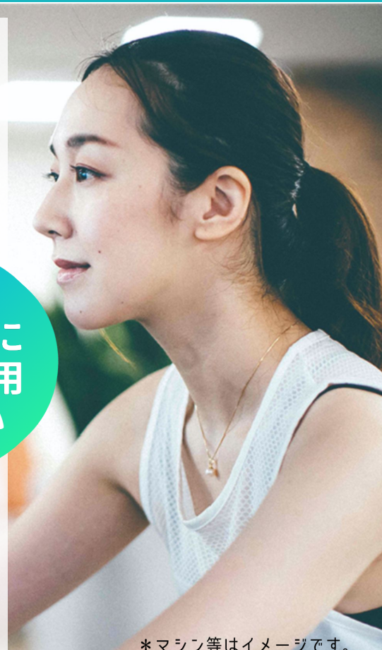
*マシン等はイメージです。